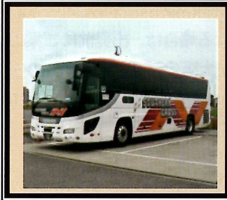
南海ウイングバス サザンクロス