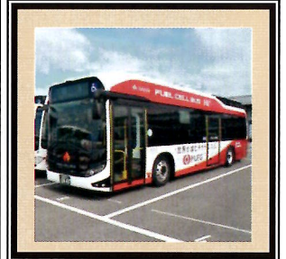
南海バス 燃料電池バス