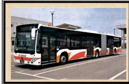
南海バス 空港島内専用 連節バス