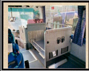
関西空港交通クルーシャトル車内